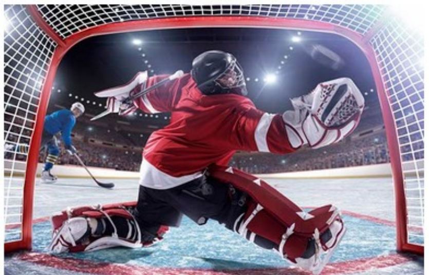
POSITION : GARDIEN DE BUT DE HOCKEY SUR GLACE. TÂCHE : BLOQUER LES PALETS. PLUS FACILE À DIRE QU'À FAIRE.

La tâche principale du gardien de but est de défendre son but en bloquant les palets adverses, et, tout en défendant avec succès ses filets, de renforcer la confiance en soi de l'équipe. Un gardien de but fort et sûr de lui permet à son équipe de jouer de manière plus offensive et lui apporte du soutien en situation de jeu critique.