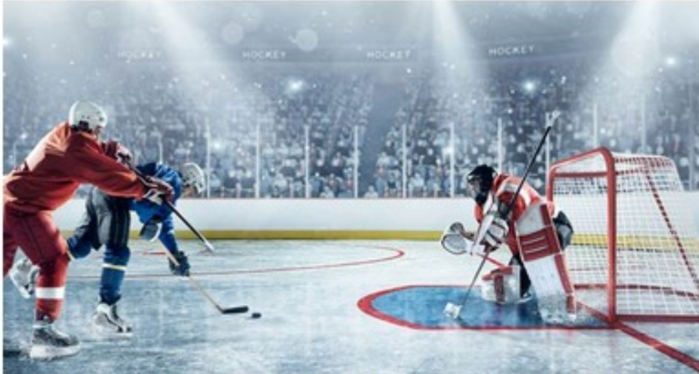
UNE CAUSE COMMUNE : LE GARDIEN DE BUT EST LE DERNIER MAILLON DE LA CHAÎNE DE DÉFENSE.

Alors que le gardien de but avait initialement pour rôle unique de protéger le but, il est s'engage de nos jours beaucoup plus dans le jeu. Il peut par exemple intercepter le palet dans la zone située derrière le but ou le passer à ses coéquipiers et ainsi déclencher une contre-attaque.